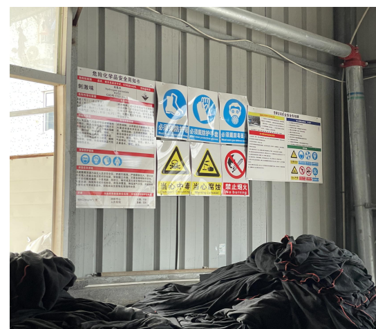
职业病危害告知卡、警示标示、指令标识