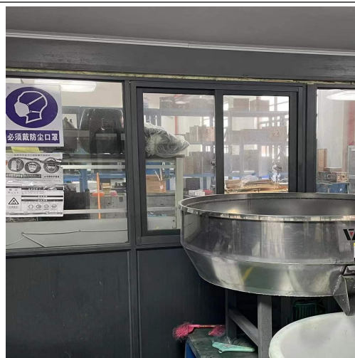
职业病危害告知卡、警示标示、指令标识