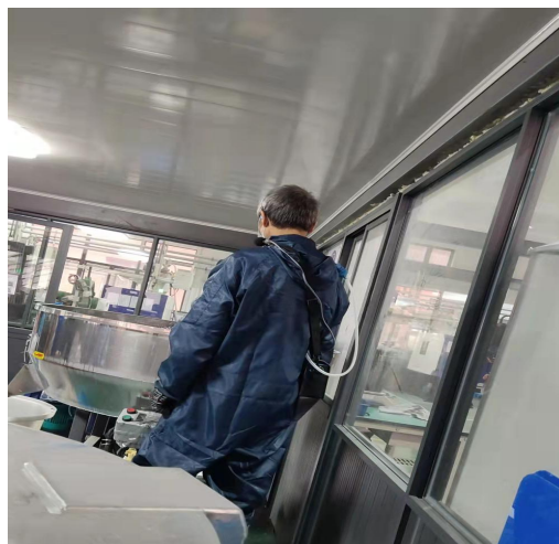
粉碎岗位（个体）采样