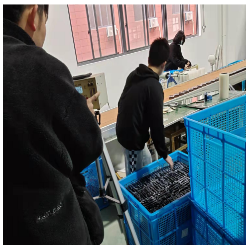
烘箱检验岗位采样